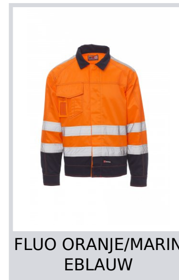
FLUO ORANJE/MARIN EBLAUW